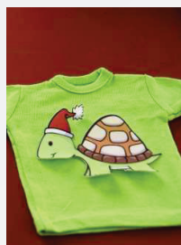
Peglati na unutrašnjoj strani